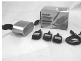
手回し携帯充電器 (1個)