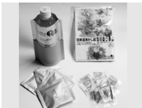
簡易湯沸かし器 (5回分: 1セット)