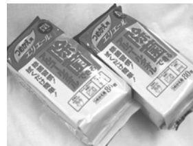
ウェットティッシュ (80枚×2)