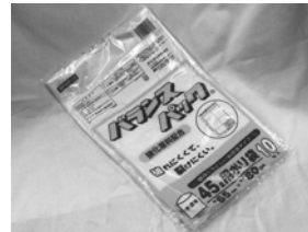
ゴミ袋 (45L: 10枚)