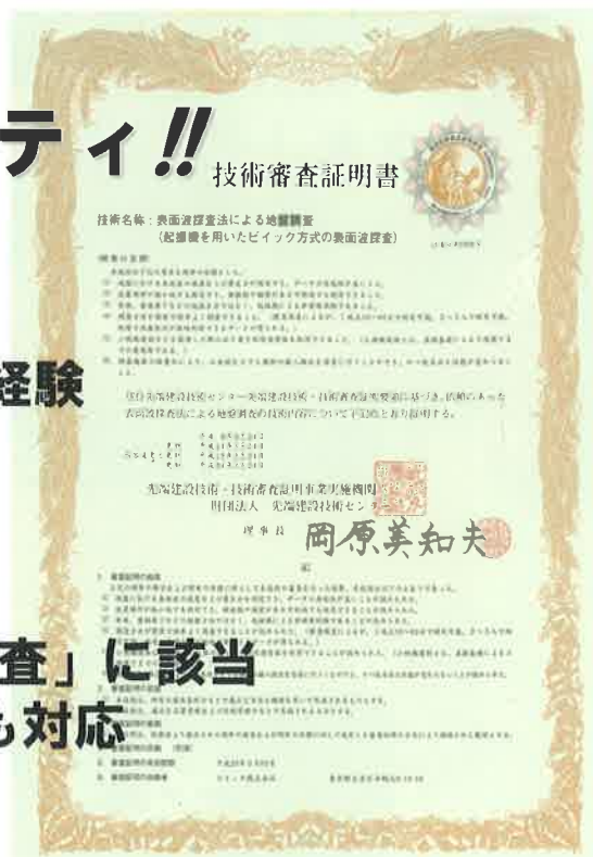
(財)先端建設技術センター 技術審査証明