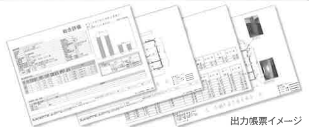
出力帳票イメージ

総合評価に加えて、寸法線入りの平面図などで見やすく、分かりやすい出力帳票。さらに写真やコメントを記載することができますので、お客様への提案も簡単です。